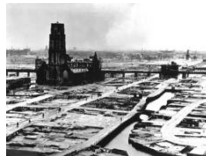
Rotterdam na het bombardement

Op 10 mei 1940 trokken Duitse legers Nederland binnen. Het Nederlandse leger kon niet tegen het Duitse op. Hitler zette vliegtuigen in. Na het bombardement van Rotterdam gaf Nederland zich over op 15 mei 1940.