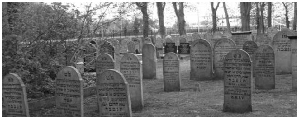
De Joodse Begraafplaats aan de Eesveenseweg in Steenwijk

Joden maakten deel uit van de Steenwijker samenleving, Ze hadden winkels en fabriekjes. Ze werden vroedvrouw of arts. Ze werden lid van de vakbond en sportverenigingen en ze werden in het bestuur van veel verenigingen en in de gemeenteraad gekozen. Wel bleven ze leven volgens de Joodse religieuze voorschriften, zoals het vieren van de Sabbath en ze aten volgens de spijswetten. Iedereen wist wie in Steenwijk Joods was, maar het bepaalde niet de manier waarop Joden en niet-Joden met elkaar omgingen.