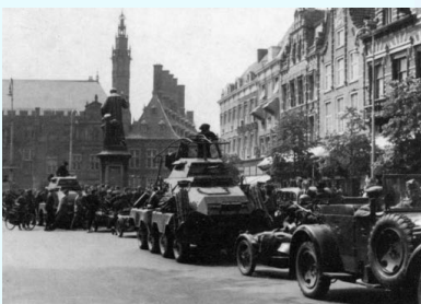
Duitse troepen in ons land