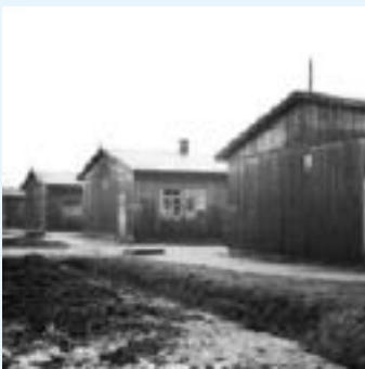
De gevangengenomen Joden werden ondergebracht in barakken. Dit zijn barakken in kamp Westerbork.