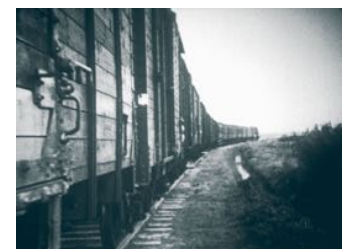
In veewagens gingen de Joden op transport naar de kampen

Vanuit Westerbork en Vught gingen de transporten naar de concentratiekampen. De Joodse Steenwijkers die in de Oost-Europese kampen aankwamen zijn daar op één na allemaal vermoord.