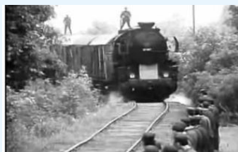
Lange treinen met Joden vertrokken vanuit kamp Westerbork naar de vernietigingskampen.