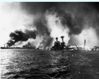
De oorlog werd op het land, op zee en in de lucht gevoerd

De wereldwijde economische crisis trof ook Duitsland. Veel mensen werden werkloos. Adolf Hitler greep zijn kans. In 1932 deed hij met zijn partij, de NSDAP (de "Nazi's"), mee aan de verkiezingen. Hij beloofde dat Duitsland weer machtig zou worden en dat er weer welvaart zou komen. Hij won de verkiezingen. Toen de president een jaar later overleed, nam hij die functie over. Hij noemde zich "Führer", dat is Duits voor leider.