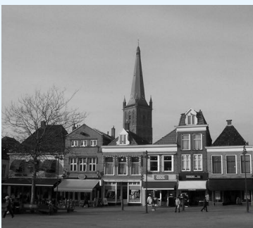
De Markt in Steenwijk.

In het pand helemaal rechts, waar nu drogisterij Etos is, woonde de familie van der Horst boven hun winkel. Daar zijn op de stoep voor hen Stolpersteine gelegd.