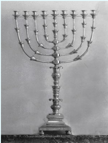
Kandelaar uit de Steenwijker synagoge

Om hun Joodse godsdienst werden zij Joden genoemd.