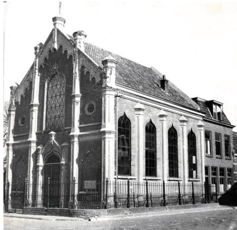
De synagoge stond aan de Gasthuispoort

Rond 1700 kwamen de eerste Joodse families in Steenwijk wonen. De Joodse gemeenschap groeide. Er werd een synagoge ingericht in een huis in de Gasthuisstraat. In 1870 werd een synagoge gebouwd op de hoek van de Kornputsingel en de Gasthuisstraat. Aan de Eesveenseweg werd grond aangekocht voor een Joodse begraafplaats.