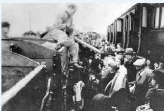
Aankomst op het station van Sobibor. Dit was een van de vernietigingskampen die door de Duitse nazi's speciaal waren gebouwd om grote groepen mensen te vermoorden. Andere vernietigingskampen waren onder meer Auschwitz, Buchenwald en Treblinka.