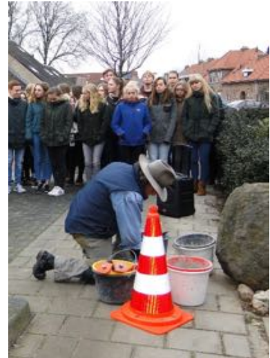
Gunter Demnig legt zelf de steentjes

De stenen zijn 10cm bij 10cm. Er is een messing plaatje op vastgemaakt met de naam, het geboortjaar en plaats en datum van overlijden.