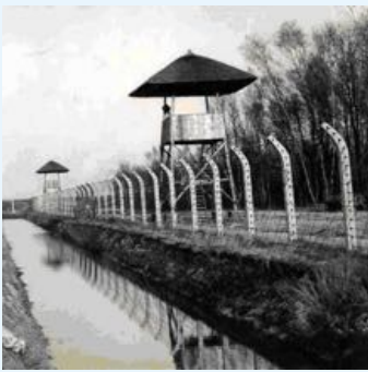
In de kampen gingen de Joden "achter het prikkeldraad". Zo zag dat er uit bij kamp Vught.